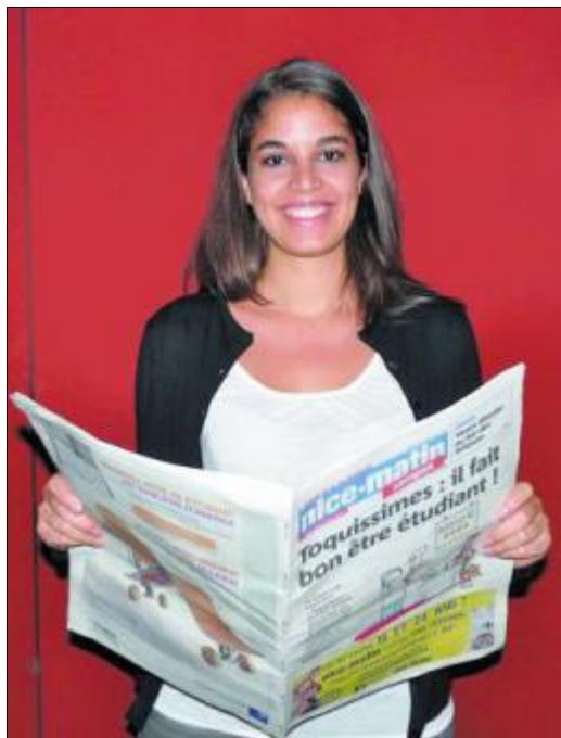
La nouvelle VPE et son équipe ont à cœur de bien faire. (ABC)

J'ai toujours aimé m'impliquer et la mission de venir en aide aux étudiants me convient bien. C'est aussi une fonction qui permet à la fois d'observer au plus près le fonctionnement de l'université et de favoriser la prise des meilleures décisions pour les étudiants. Enfin, il y a un aspect « apprentissage des